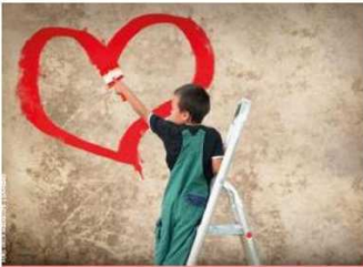
Herbstsammlung der Caritas