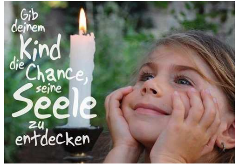
Gestaltung: Art für Gemeindedienst Nürnberg