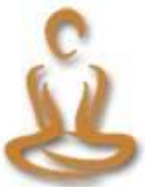
Grafik: Stephan Eideloth